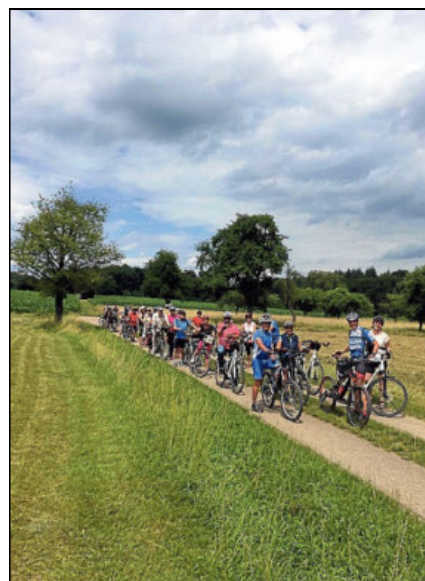
Bei der Radtour am Sonntag, 26. Mai, geht es durch geschichtsträchtige Orte im südlichen Kraichgau.

Sinsheim. Die zweite Ausfahrt mit Bike- und Touren-Guide Johannes Lang startet am Sonntag, 26. Mai, um 9.30 Uhr am Bahnhof in Sinsheim. Von dort geht es auf dem Elsenzradweg nach Eppingen, wo es Gelegenheit