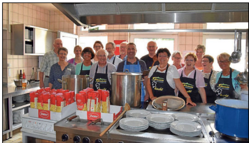
Wenn der Oberbürgermeister kocht, steht ihm das fleißige Küchenteam zur Seite.

Am 6. Juni im Katholischen Gemeindehaus St. Josef