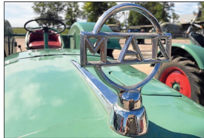
Auf Hochglanz poliert präsentieren sich die Schlepper am letzten Mai-Weekend.

Agri Historica am Samstag und Sonntag, 25. und 26. Mai