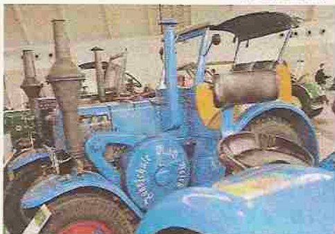
Diese schöne LANZ Straßenzugmaschine war bei der Veranstaltung in 2010 neben

Die Bulldog- und Schlepperfreunde Württemberg werden hier in Halle 8, wie in den vergangenen vier Jahren, als Sonderausstellung Oldtimer Traktoren und historische Geräte aus der Landwirtschaft vorstellen und vorführen. In der „Besenwirtschaft“ des BuSF, die neben dem Infowagen eingerichtet wird, können sich Freunde des alten Eisens nach ermüdendem Messebummel gegen eine bescheidenen Spende bei einer rustikalen Vesper erholen. Hier trifft man auch Bekannte und lernt neue Leute kennen.