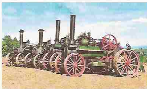
Ein Bild mit Seltenheitswert. Vier betriebsbereite Dampfplugs-

lokomotiven nebeneinander auf dem Feld wird man in Deutschland kaum noch einmal zu Gesicht bekommen. In der BRD existieren insgesamt nur sieben solcher Maschinen.