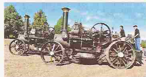
Die beiden Fowler Dampfplugs-lokomobile des Vereins Historische

Im Rahmenprogramm der Veranstaltung wurde aus Anlass des 100. Geburtstag der beiden museumseigenen Heucke Dampfplugs-Lokomotiven ein Dampfplügen vorgeführt. Dazu wurde der Verein