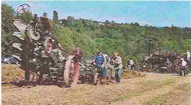
Der 4-Schar Kipp-Pflug wird mit einem 23 mm dickem und 500 Meter langem Stahldrahtseil über das Feld gezogen.