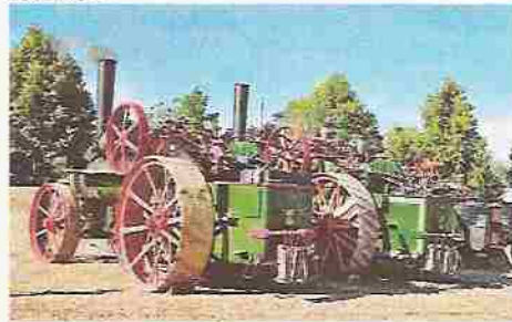
Die beiden Heucke Maschinen des Deutschen Landwirtschaftsmuseum Hohenheim.

Historische Dampftechnik Kirchheim unter Teck e.V. eingeladen, die einen Dampfplugsatz von Fowler Ltd. Leeds mitbrachten, so dass mit vier Dampfmaschinen mit dem 4-Schar Kipp-Pflug gearbeitet werden konnte.