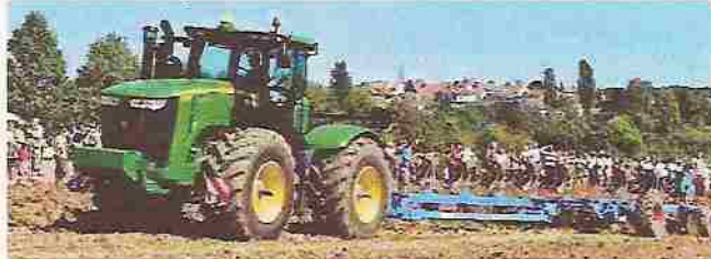
Der John Deere 9560 mit dem elf-scharigen Lemken-Pflug.

Von der Agria 3400 mit Einschar Drehpflug bis zu den Zugmaschinen und Bodenbearbeitungsmaschinen von heute, die hier in Form eines John Deere Allrad-Knicklenker Typ 9560 mit 560 PS und elf-scharigem Lemken-Pflug zum Einsatz kamen.