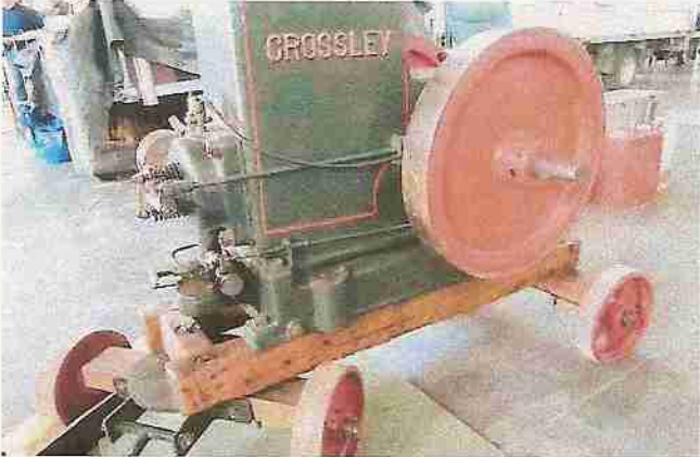
Auch drei schöne, interessante Stationärmotoren konnten im Vorführing begutachtet werden. Hier ein Gorrssley aus Manchester in England.