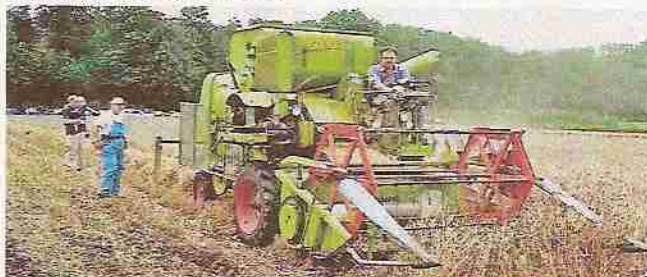
Ein Claas Columbus Mähdrescher bei der Vorführung

Der größte Teil der Besucher zeigte wenig Interesse an der Traktor-Ausstellung, der Getreideernte und dem Pflügen. Im Hof dagegen war ständig ein großes Gedränge. Es gab allerdings auch kein Sprecher der die Traktoren vorstellte und die Vorführungen auf dem Feld kommentierte.