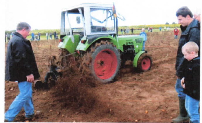
Der Schleuderradroder mit Zapfwellenantrieb funktionierte bei dem feuchten Boden von allen Geräten die hier im Einsatz waren am besten, denn auch bei langsamer Fahrt der Zugmaschine konnte das Schleuderrad mit voller Drehzahl die Kartoffeln von der feuchten Erde trennen.