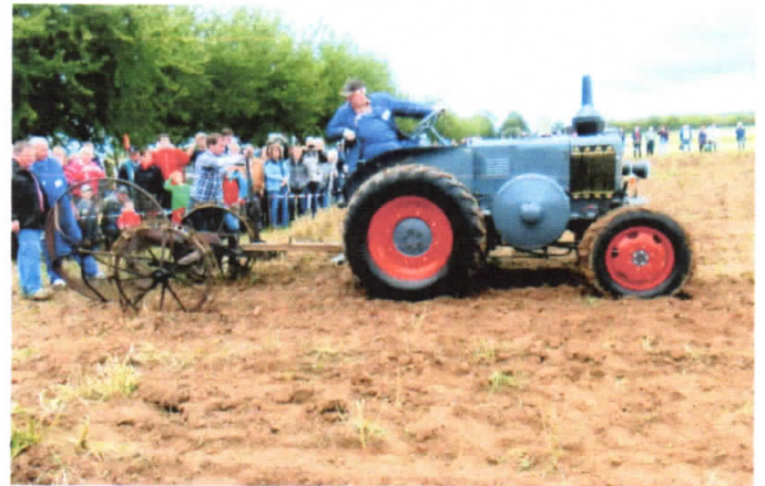
Ein Lanz Glühkopf Bulldog D9506 mit einem Grimme Schleuderradroder mit Fangkorb der die Kartoffeln auffängt und seitlich ablegt.

Ein Roder der Fa. Stoll mit 5 über ein interessantes Getriebe bewegte Grabgabeln heben die Kartoffeln schonend aus dem Boden und legen sie seitlich ab. Gezogen wurde der Roder von einem Allgaier A22.