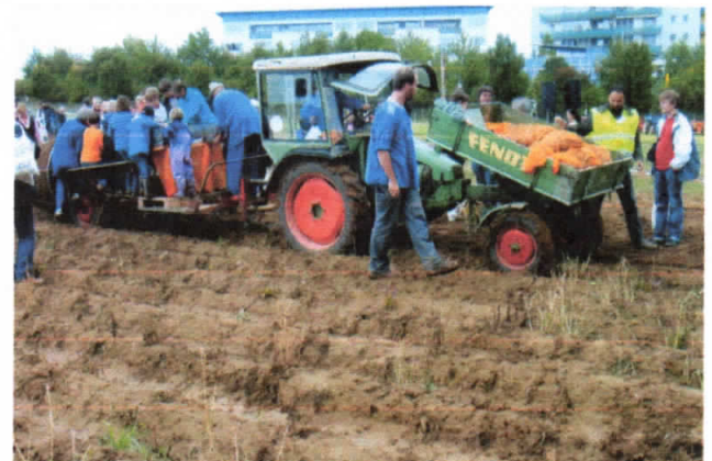
Der Kartoffel-Vollernter aus den 50er Jahren mit Zapfwellenantrieb wurde von einem Fendt