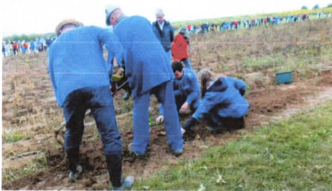
Kartoffelernte von Hand mit dem Karst wie sie über Jahrhunderte üblich war.

Der Boden des Kartoffelfeldes war nach dem Regen des Vortages noch sehr nass. Kein Landwirt hätte bei einem solchen Boden versucht Kartoffeln zu ernten.