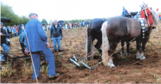
Der Kartoffel-Rodepflug gezogen von zwei Pferden war der Beginn der Mechanisierung der Kartoffelernte.