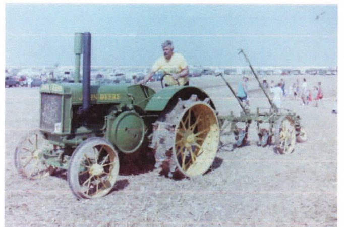
Bilder von Roland Steiger